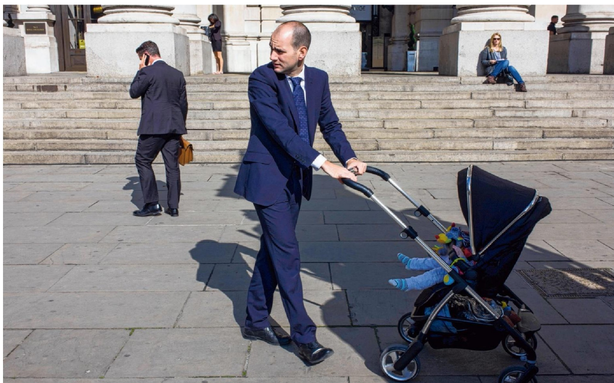
Man in pak met kind in The City (Londen). In Nederland vervullen mannen veel minder vaak dan vrouwen zorgtaken thuis.