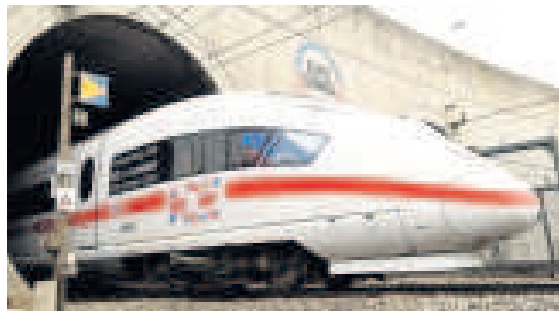
De ICE van Siemens.