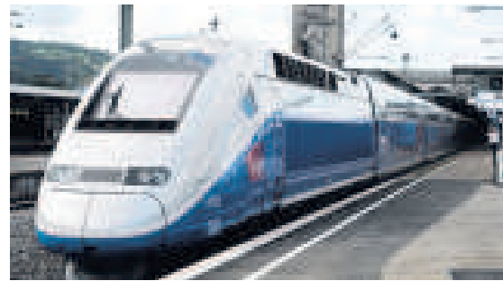
De TGV van Alstom.