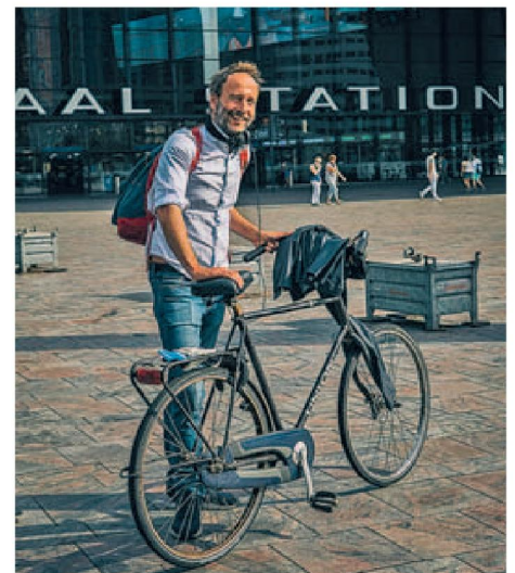
'IK HEB TWEE OUDE FIETSEN'

'Ik heb in Etten-Leur precies dezelfde fiets, maar dan in het rood. De ov-fiets vind ik te duur voor dagelijks gebruik. Deze kostte me 70 euro en ik stal hem hier gratis. Als de ov-fiets goedkoper zou zijn, dan zou ik hem vaker gebruiken. De oBike zou voor mij wel een alternatief zijn, maar ik heb nu deze fiets al.'