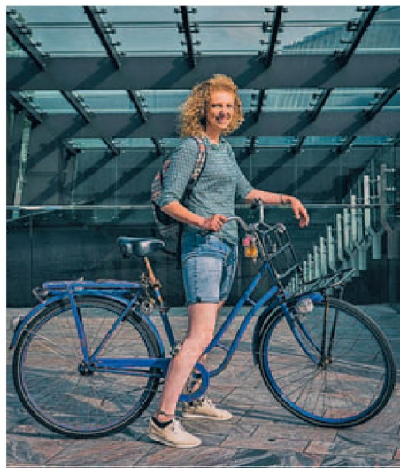
'OV-FIETS IS ME TE DUUR'

'Normaal heb ik mijn eigen fiets, maar die is gestolen. Hij stond hier in de ondergrondse fietsenstalling. Die wordt niet bewaakt, ook al hangen er wel camera's. De ov-fiets gebruik ik nu omdat ik even geen fiets heb. Maar na de vakantie koop ik er weer een. Het is veel goedkoper om zelf een fiets te hebben.'