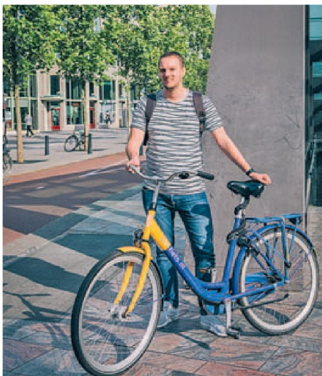
'MIJN FIETS IS GESTOLEN'

loopt tegen de grenzen aan.' 'Conceptueel is een initiatief als oBike goed, maar de fiets moet worden doorontwikkeld. Een degelijke Nederlandse fiets met een smart-lock bijvoorbeeld.' Alleen dan krijg je forenzen zover dat ze niet meer op hun eigen fiets naar het station gaan, denkt Haverman. 'De oplossing is simpel: fietsen moeten fietsen, niet stilstaan bij stations.' De tientallen oBikes rondom het station in Rotterdam staan tijdens de spits voorlopig stil. In de stromen fietsers is geen enkele gele deelfiets te spotten. Forenzen verkiezen hun stadsbrikkie: goedkoper en het fietst een stuk prettiger dan zo'n Chinese deelfiets. <