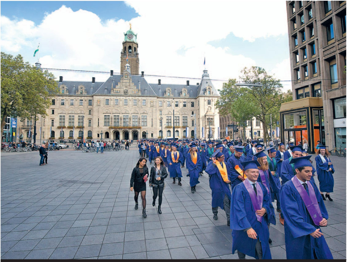
Afgestudeerden van de Rotterdam School of Management op weg naar hun diploma-uitreiking. De opleiding is ooit opgezet door leidinggevendens uit het bedrijfsleven, maar die hebben het er niet voor het zeggen.