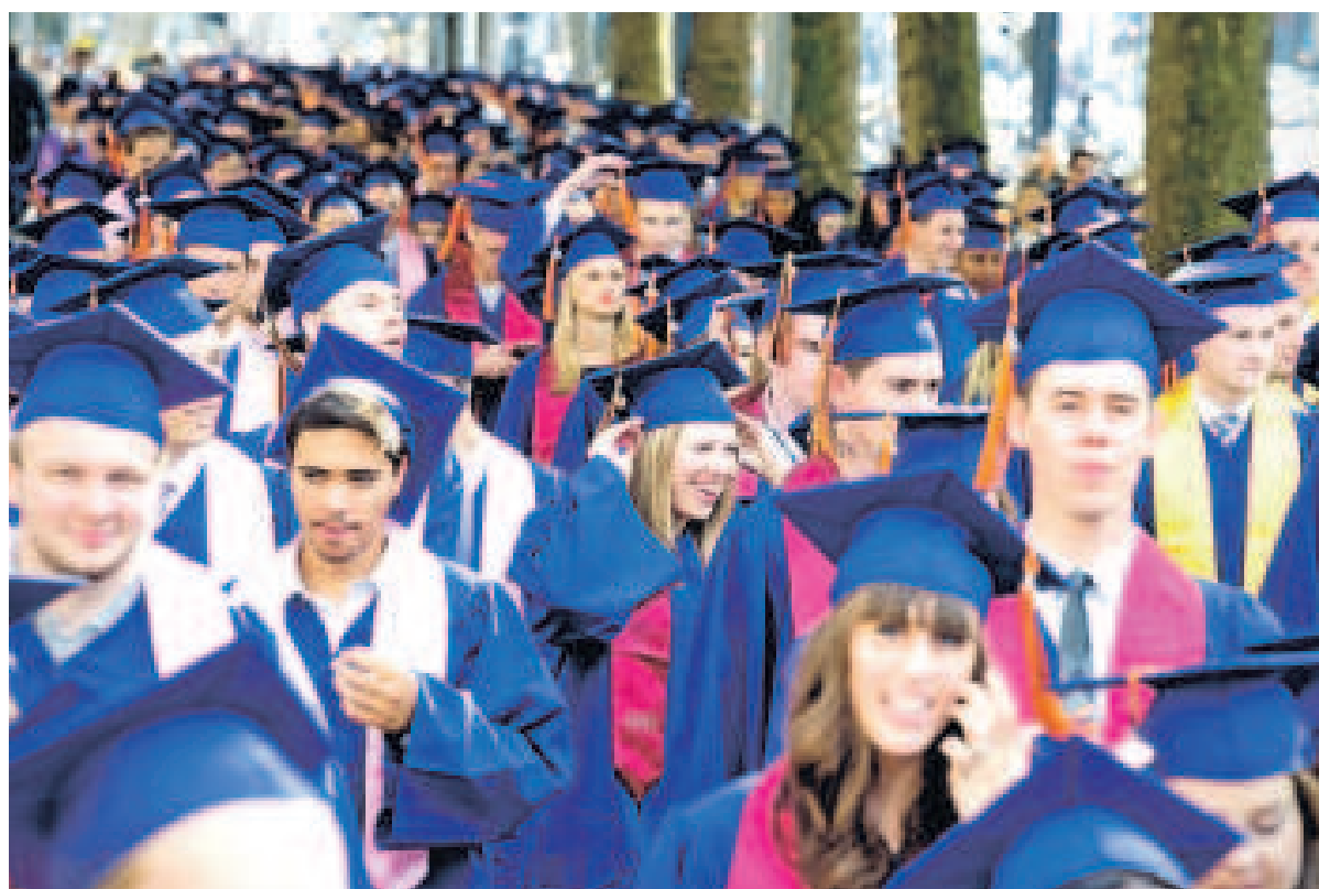
Ruim 700 studenten van de Rotterdam School of Management krijgen hun diploma.

‘De regering zal artikel 50 eind maart 2017 in stelling brengen. Het plan is waarschijnlijk dat Groot-Brittannië in maart 2019 zich formeel zal terugtrekken, op tijd om af te zien van de deelname aan de Europese verkiezingen van 2019. Maar ze heeft nog niet in detail duidelijk gemaakt wat een Brexit betekent. Ze zoekt een voordeelige relatie met de Europese markt, zonder daar deel van uit te maken. Dat is een grote gok en details zijn cruciaal. De European 1972 Communities Act, de grondslag van het EU-lidmaatschap, wordt niet direct ingetrokken. Maar May wil dat de veroudering wordt vastgelegd in een wet als een gebaar dat er geen weg meer terug is. Maar dat brengt ons niet dichterbij een idee van wat een Brexit echt betekent. May had weinig keus: ze moest het initiatief over Europa wel nemen. Op deze manier houdt ze controle over de agenda.’