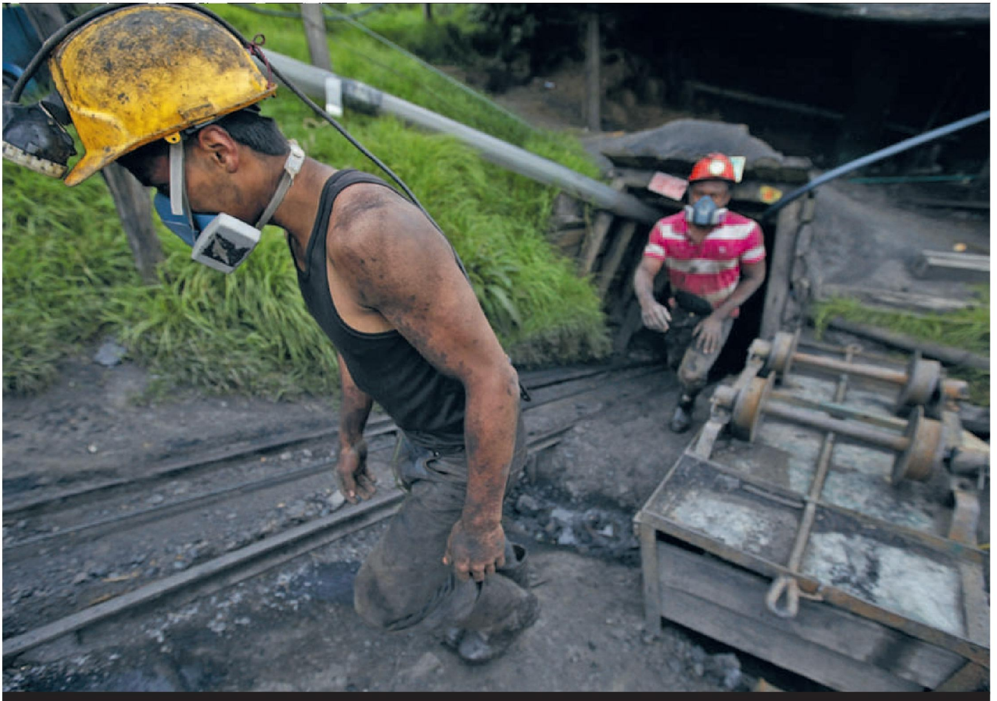
Werknemers van een kolenmijn in Colombia gaan na hun werkdag naar huis. Energiebedrijven zijn grote afnemers van steenkool uit Colombia, ook nadat er in 2013 – en niet voor het eerst – vakbondsleiders werden vermoord.

CEES VAN DAM EN HELEEN TIEMERSMA • hoogleraar Onderneming en Mensenrechten, resp. onderzoeker, aan de Rotterdam School of Management van de Erasmus Universiteit nd.nl/opinie