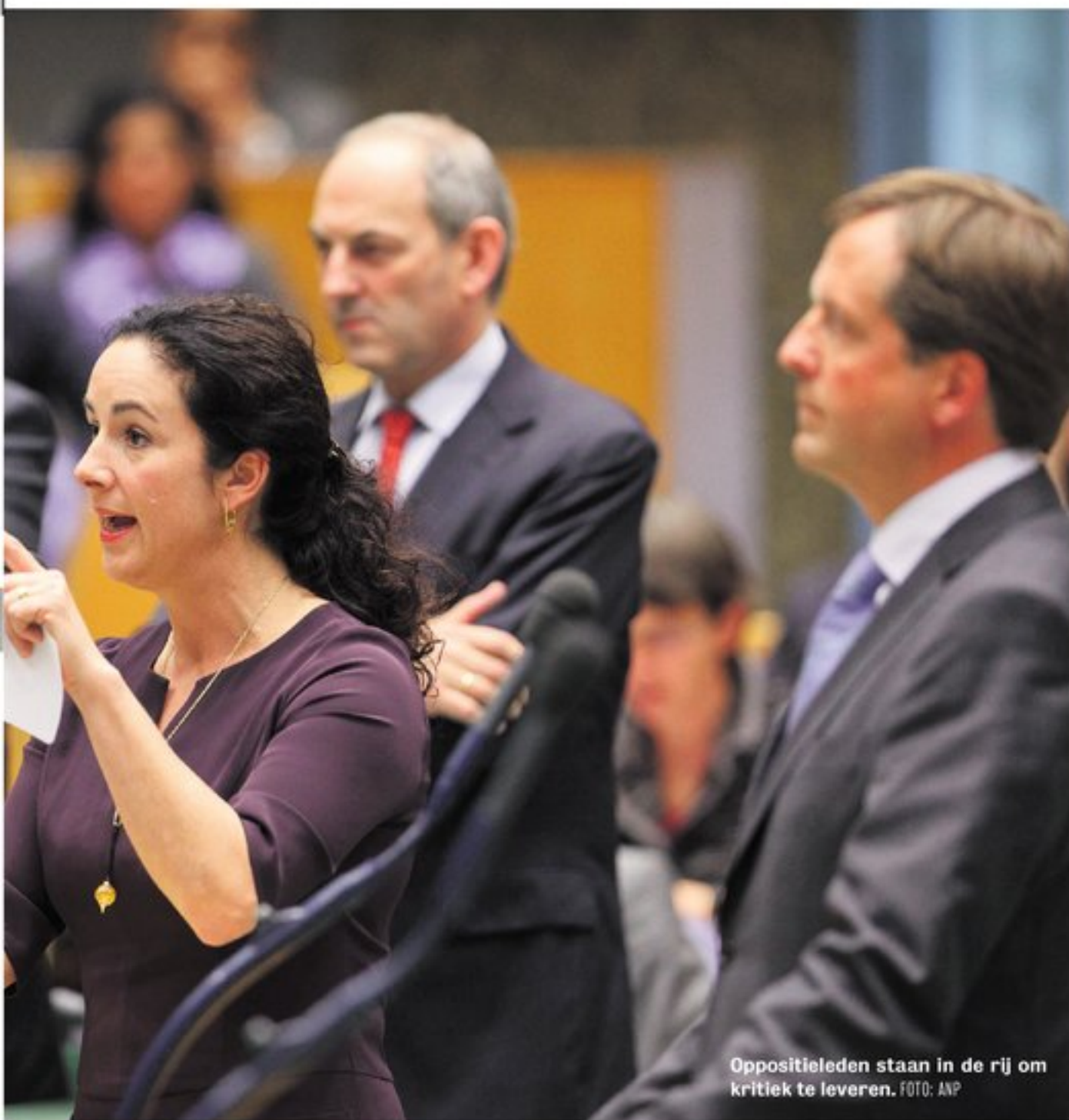
Oppositieleiden staan in de rij om kritiek te leveren.