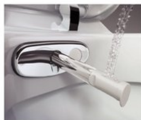
Reinigen met water: beter, hygiënischer, comfortabeler

Reinigen met water is in Nederland nog lang niet ingeburgerd; onbekend maakt onbemind, zo blijkt. De wc met geïntegreerde douche kan nog flink wat veld winnen. De meeste Nederlanders kennen dat systeem niet, maar iedereen hecht wel grote waarde aan hygiëne. Dat terwijl ruim een derde zich niet schoon voelt na toiletgebruik en bijna de helft min of meer regelmatig last heeft van 'remsporen' in het ondergoed. Ruim twee derde van de Nederlanders denkt dan ook dat ze zich schoner