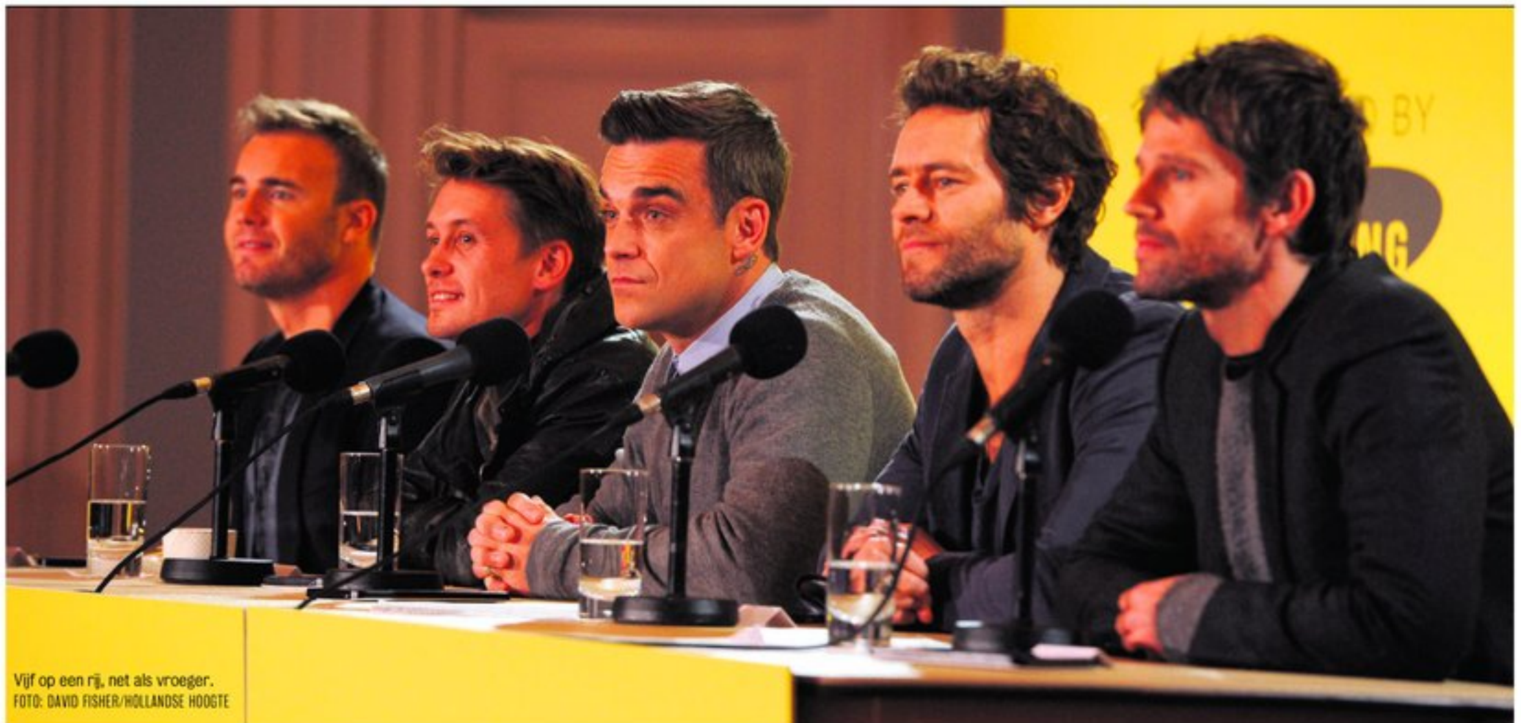
Vijf op een rij, net als vroeger.