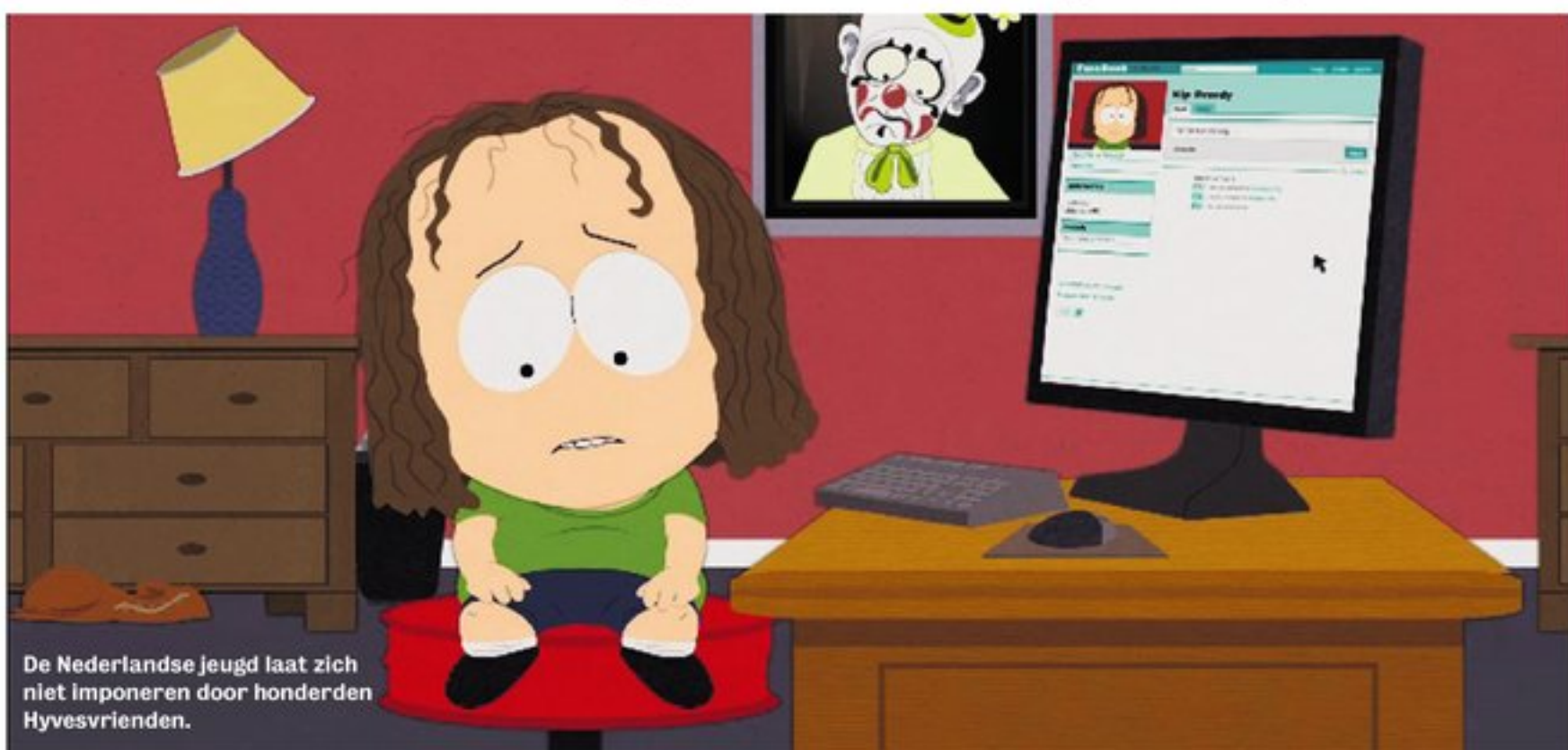
De Nederlandse jeugd laat zich niet imponeren door honderden Hyvesvrienden.