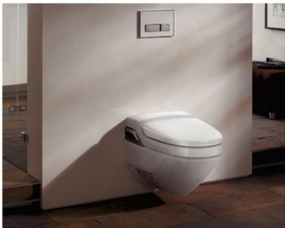
Compleet hoogwaardig wandtoilet met geïntegreerde douche

Water is 100% anti-allergeen. Op lichaamstemperatuur biedt water bovendien de mildeste en veiligste reiniging. Verder zorgt een - al dan niet pulserende - douchestraal voor zachte massage die de doorbloeding stimuleert, de stoelgang helpt en problemen verzacht of zelfs voorkomt. Reinigen met water geeft bovendien een prettig en fris gevoel. Al die goede eigenschappen zijn bij elkaar gebracht in de nieuwe Geberit AquaClean serie. Deze hygiënische wc-producten zijn er in verschillende uitvoeringen, voor bestaande en nieuwe wc's en passend binnen elk budget. Zo is er een losse Geberit AquaClean toiletzitting in drie verschillende uitvoeringen met geïntegreerde douche voor installatie op een bestaande wc. De aanpassing