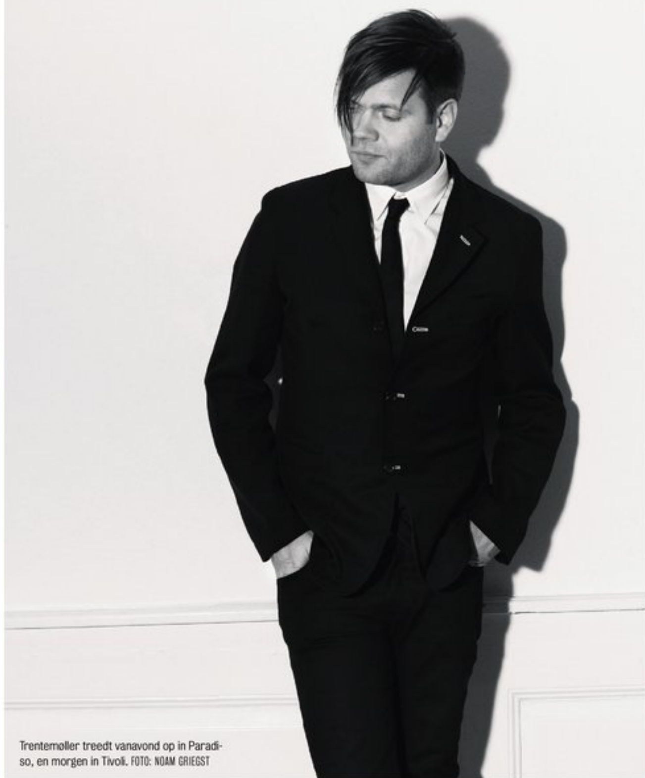
Trentemøller treedt vanavond op in Paradiso, en morgen in Tivoli.

Inclusief een 2-jarig KPN Personal Sim 260 + SurfMail Total (250 min/250 sms+internet). Normaal 43,50 p/mnd. Nu je leven lang slechts 34,80 p/mnd. Inruil: lever je oude toestel max. 1 per persoon. Vraag naar de actievoorwaarden in de winkel.