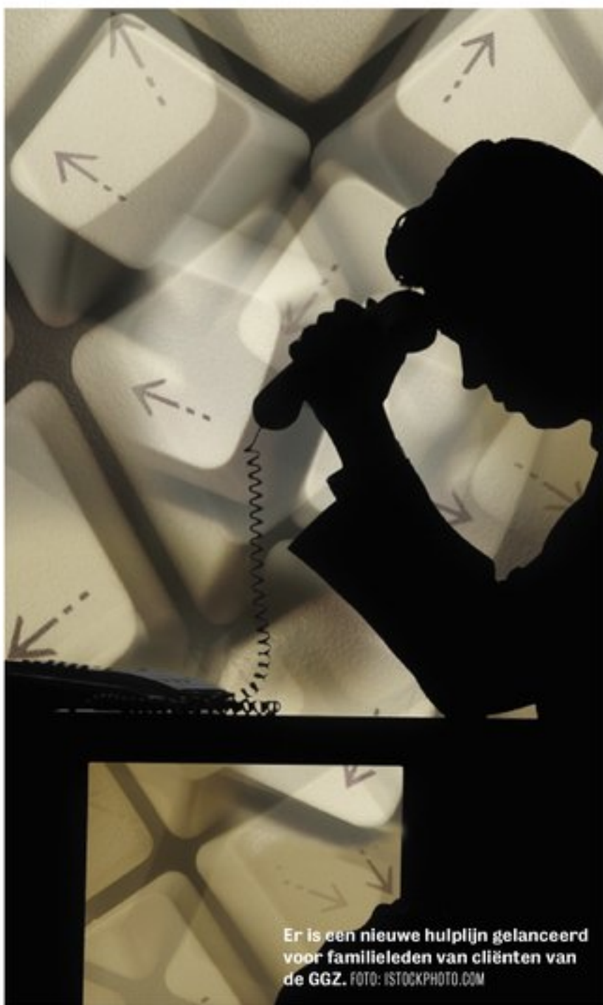
Er is een nieuwe hulplijn gelanceerd voor familieleden van cliënten van de GGZ.