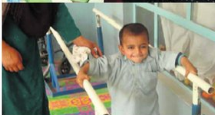
Beelden van het Miracle Centre in de Noord-Afghaanse provincie Kunduz waar de ontvoerde Nederlander zou werken.