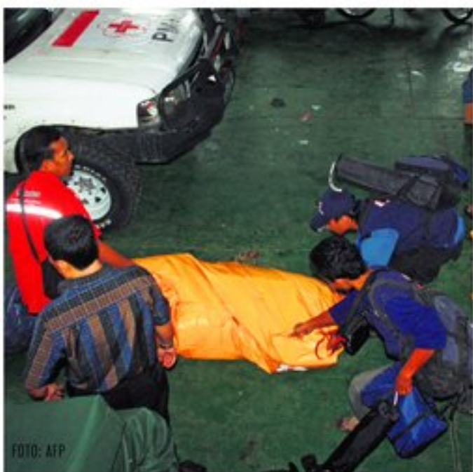
Hulpverleners bereiden zich voor op de evacuatie van tsunamislachtoffers.