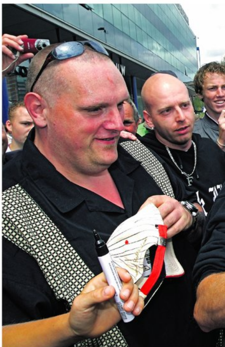
Mario Been is nog net zo populair als tijdens zijn eerste oefensessie als trainer van Feyenoord. Daar kan zelfs een 10-0 nederlaag geen verandering in brengen.