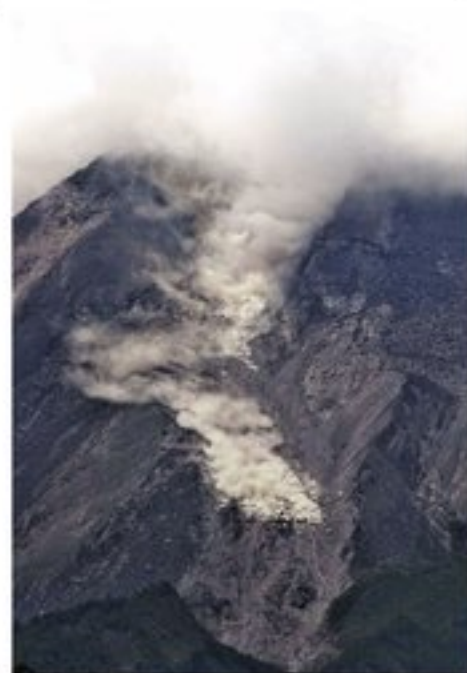
Vulkaan 'Berg van Vuur'