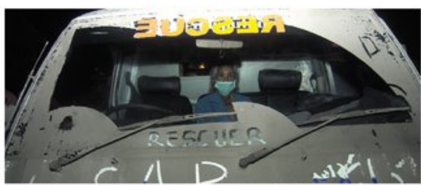
As bedekt een auto in de buurt van de dodelijke vulkaan.

Lokale autoriteiten krijgen van vulkanologen het advies om een verbod in te voeren op het uitvoeren van activiteiten in de rivier vlakbij de top. Verder waarschuwen ze officials om onmiddellijk