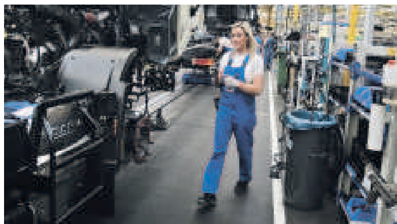
Assemblagemedewerker is een middenbaan.