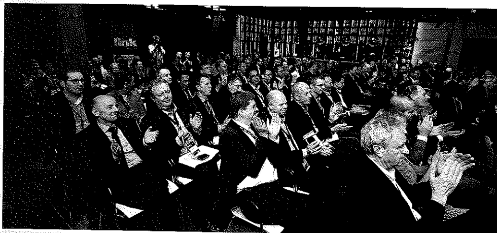
Het belooft op 25 november bij het DISCA-event, net als vorig jaar, weer volle bak te worden.

De afgelopen maanden hebben uitbesteders honderden leveranciers genomineerd voor de Best Knowledge en Best Logistics Award 2015 (twee van de drie Dutch Industrial Suppliers & Customer Awards (DISCA, voorheen DISA). Met als resultaat twee lijsten, met veel namen van bedrijven die al (veel) vaker door deze eerste selectieronde heen zijn gekomen. Maar ook van tal van ondernemingen die schijnbaar uit het niets naar voren worden geschoven. De komende maanden volgt een nadere selectie. De uiteindelijke winnaars krijgen op 25 november hun onderscheiding. Overigens levert de rondvraag van Link Magazine niet alleen lijstjes met voorkeursleveranciers op, maar ook soms stevige argumenten voor het juist niet nomineren.