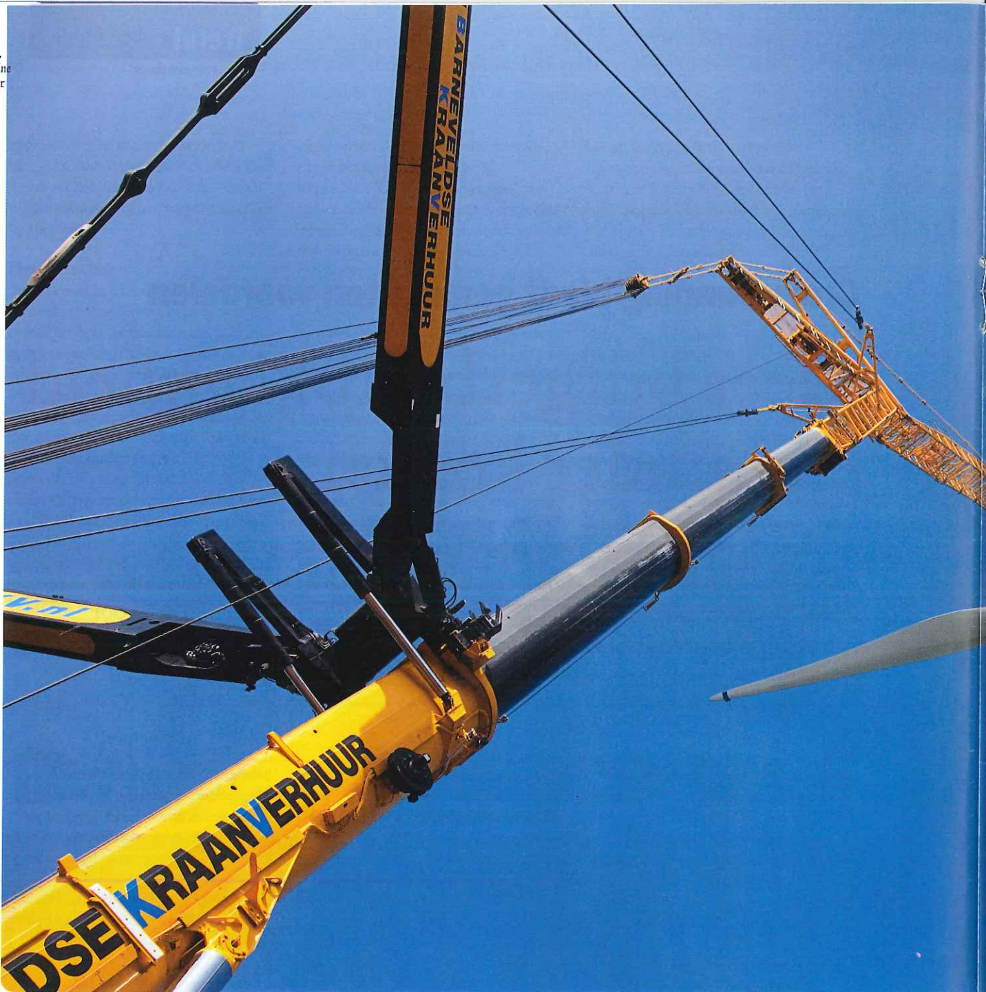
Steun aan crowdfunding kan gemeenten helpen gemeentelijk beleid uit te voeren

voor een grotere capaciteit voor een molen die nog steeds meel maakt.'