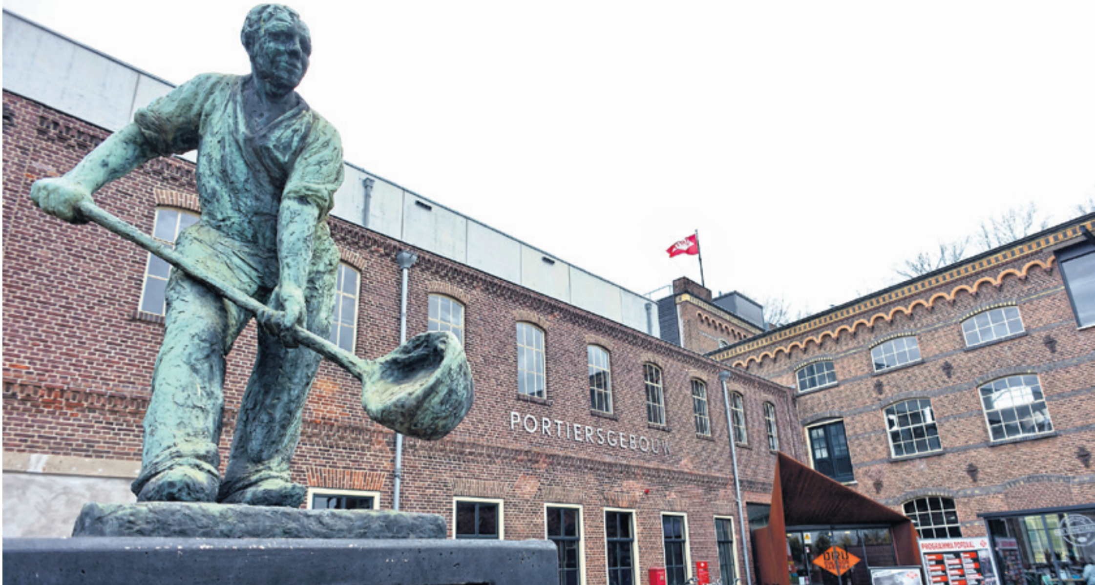
Vroeger werd er ijzer gesmolten, nu is de in 1973 gesloten ijzergieterij van DRU in Ulfthoek een smeltkroes van bedrijvigheid, recreatie en culturele activiteiten.