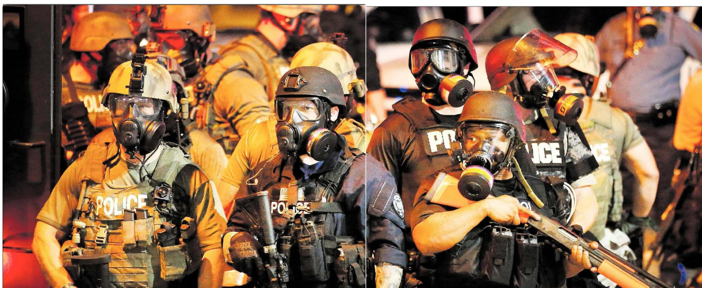
Agenten in de stad Ferguson in de Amerikaanse staat Missouri proberen met veel militair vertoon een demonstrerende menigte te verdrijven.