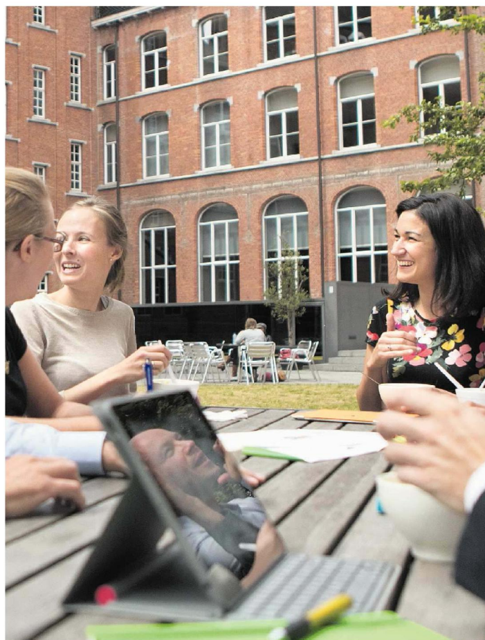
De Vlerick Business School in Gent. Op de wereldwijde ranglijst voor executive onderwijs van The Financial Times staat Vlerick met een 38ste plaats het hoogst in de Benelux.