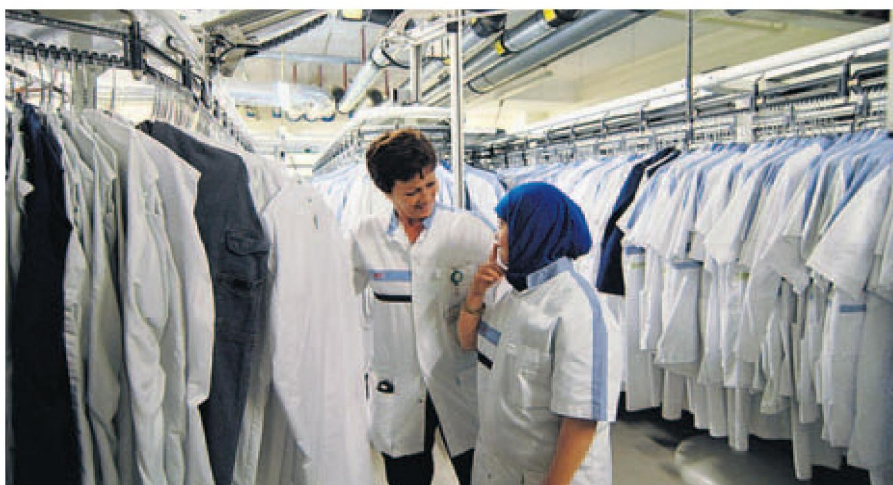
Helpen in de wasserette van ziekenhuis MCH Westeinde in Den Haag tijdens de Prokkelweek.

‘Als je wilt dat het werk wordt gedaan, moet je iemand kiezen die het druk heeft.’