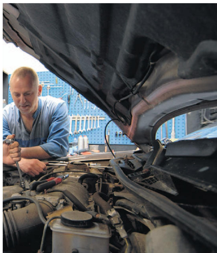
Garage van Asch in Den Haag. In de Prokkelweek worden bedrijven uitgedaagd mensen met een verstandelijke beperking een dag aan het werk te zetten.