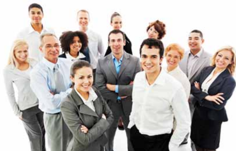
Hoogwaardigste flexibiliteit bereik je als je professionals multi-inzetbaar weet te maken.

Op de website www.flexibiliteitsaudit.nl kunt u onder andere met een quick scan kijken hoe flexibel uw organisatie is.