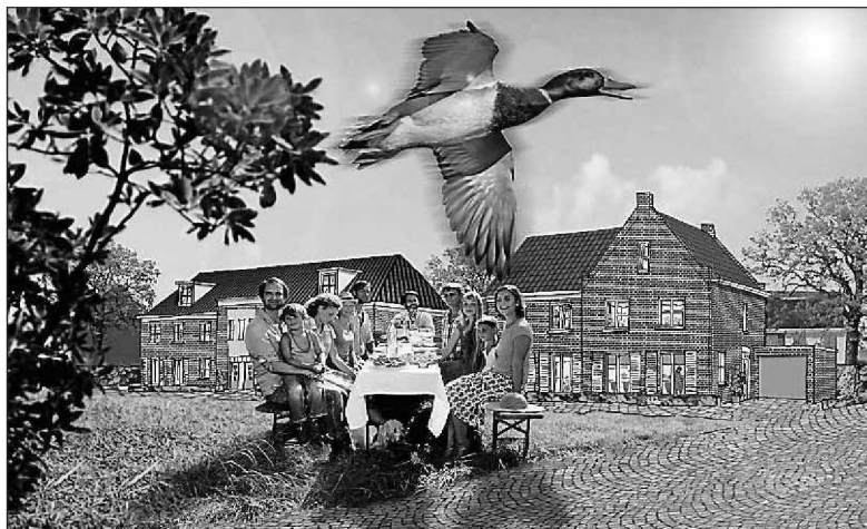
• Een loungeplek, moestuin, lange tafel om gezamenlijk aan te eten of een trapveldje, de bewoners kunnen daarover allemaal meedenken in de Almeerse wijk Nobelhorst.

springen, gaat zelf aan de slag met ideeën van de bewoners,” zegt Meijs. „Zo'n buurt zal er bijvoorbeeld netter uitzien dan een andere omgeving waar minder betrokkenheid is. Het gevaar van 'neerwaartse jaloezie' ligt daarbij op de loer. Een wijk die zich uitslooft om er iets moois van te maken kan zich op een bepaald moment afvragen: 'Zijn wij nu gekke Henkie of niet?' Een buurt waar weinig gebeurt en die 'zielig' gevonden wordt, krijgt namelijk toch wel de helpende hand van de gemeente, zodat het er daar ook keurig uitziet.”