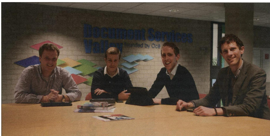
De Business Developers van de Document Services Valley.