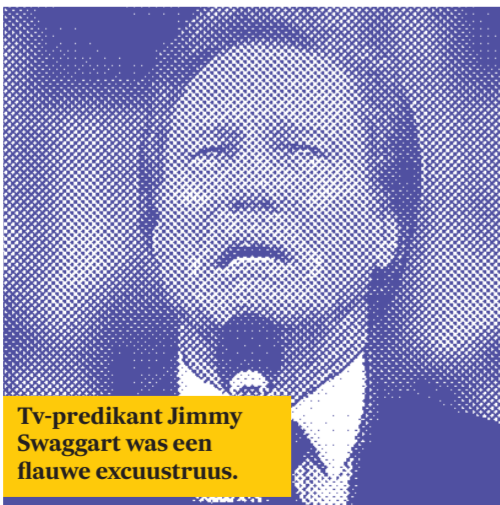
Tv-predikant Jimmy Swaggart was een flauwe excuustruus.

Elke dinsdag stelt Sjoukje Smedts een ongemakkelijke vraag over kunst en leven.