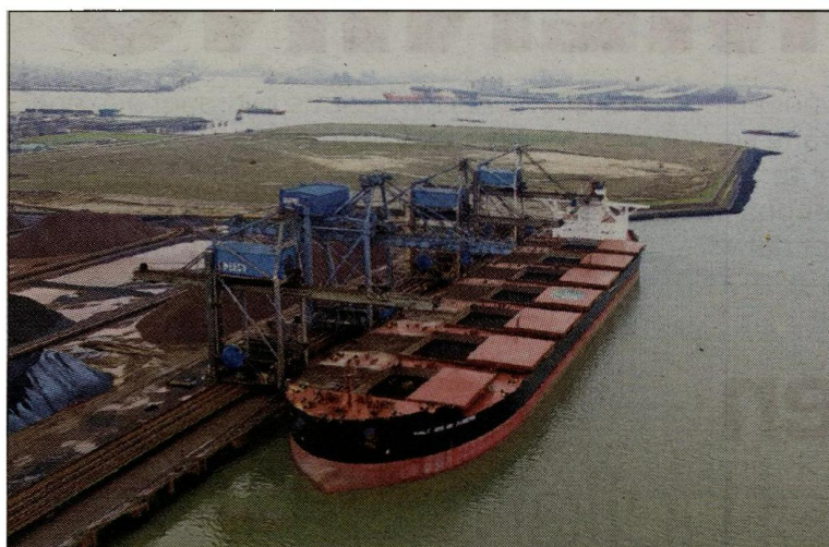
De Nederlandse havens zijn de best toegankelijke ter wereld. Hier wordt de Vale Rio de Janeiro, de grootste ijzererts-carrier ter wereld, gelost in de haven van Rotterdam.