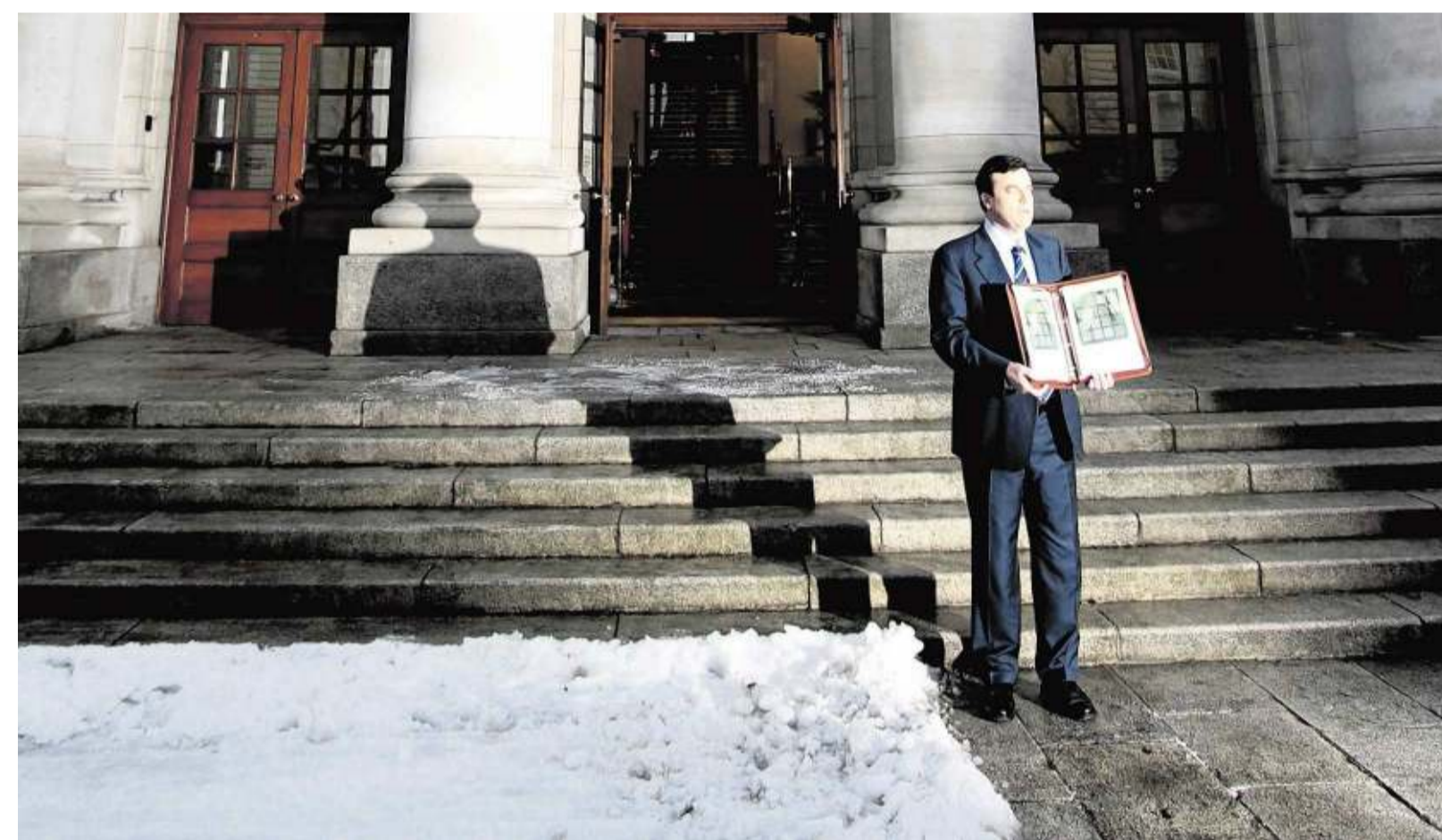
De Ierse minister van Financiën Brian Lenihan presenteerde vorige week dinsdag de 'noodbegroting' voor 2011 voor het regeringsgebouw in Dublin. Lenihan liet de uitbetaling van bonussen aan bankiers blokkeren. Eerder stelde hij een bonusbelasting van 90 procent voor.

In Spanje en Ierland zijn optimistische bankiers een belangrijke oorzaak van de uiteengespatte vastgoedmarkt. Doordat de banken te makkelijk geld staken in de florerende huizen- en kantorenmarkt, moesten beide overheden na het inzakken van de vastgoedmarkt bijspringen. Ierland kon deze bankenredding niet meer zelf betalen en vroeg vorige maand steun bij het noodfonds van de eurolanden en het IMF. Spanje kon de kapitaalinjecties voor noodlijdende Spaanse spaarbanken wel zelf betalen. Maar obligatiebeleggers vrezden dat de Spaanse regering uiteindelijk toch ook moet aankloppen bij het noodfonds. De vraag is of de Ierse en Spaanse bankiers in hun jacht op ho-