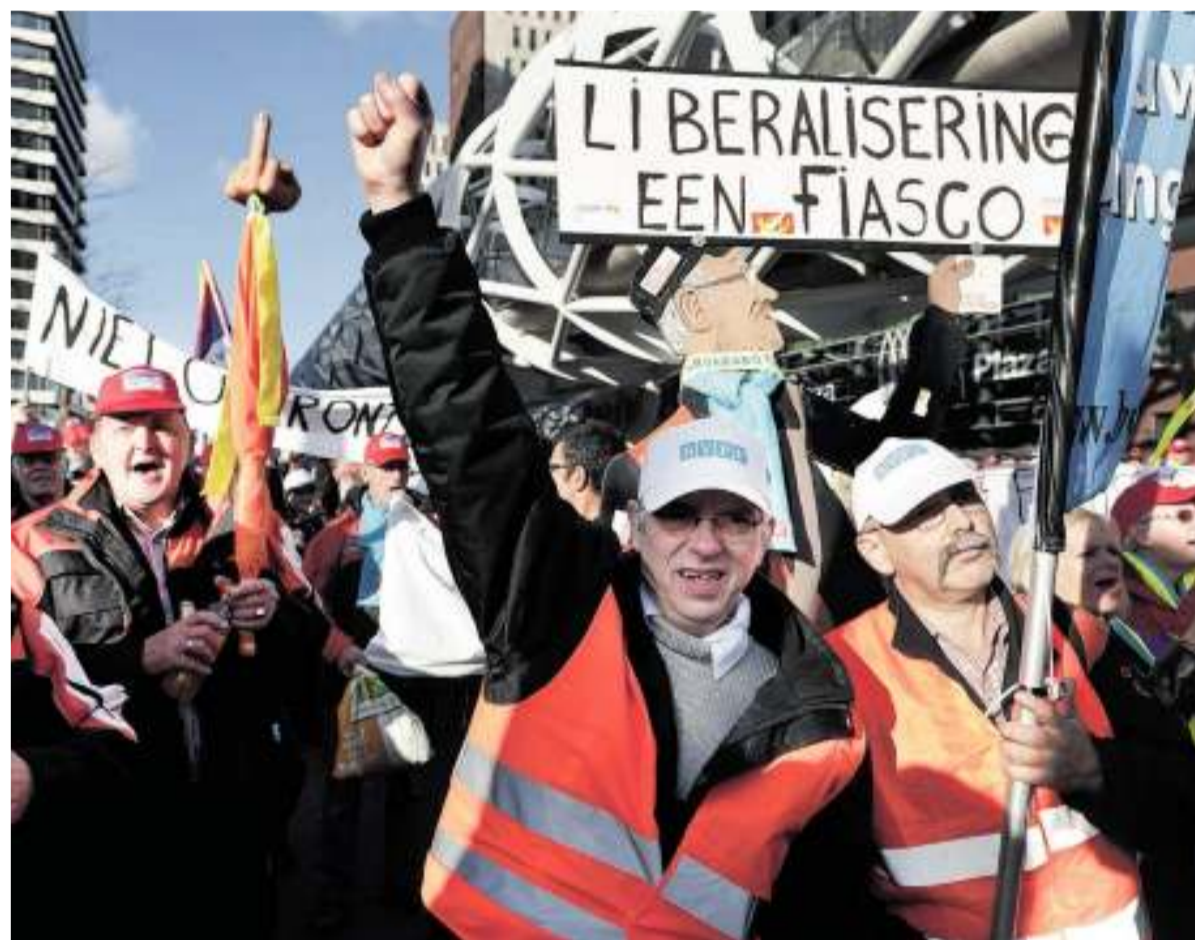
TNT-werknemers protesteren voor het hoofdkantoor in Den Haag, 16 november.

De reorganisatie bij TNT Post is het gevolg van automatisering, heftige concurrentie op de postmarkt en een dalend postvolume. Om te kunnen blijven concurreren, schaft TNT het beroep postbode af. Deze fulltime werknemer wordt vervangen door de goedkopere, parttime postbezorger.