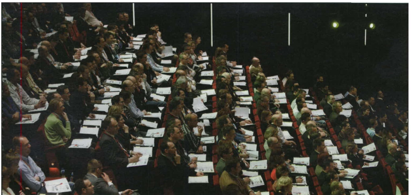
'Als je studenten van hoog niveau uit alle werelddelen bij elkaar zet, kan er iets groots gebeuren'