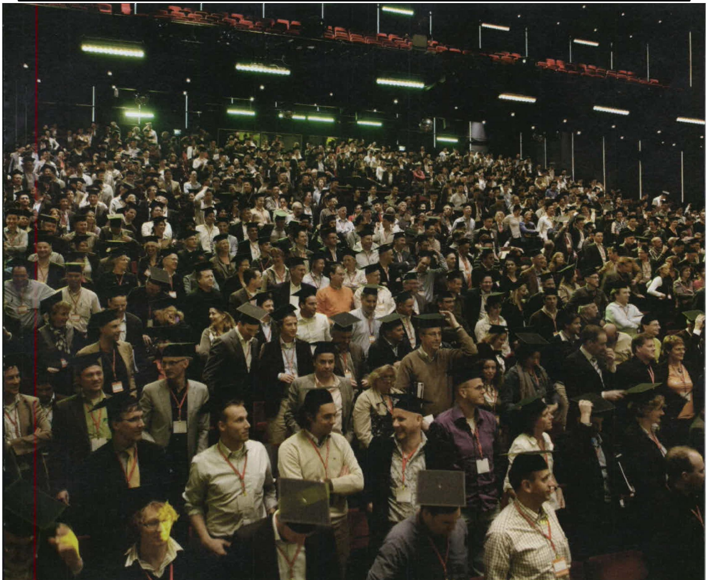
'Mensen nemen meer verantwoordelijkheid voor hun carrière. Soms willen ze niet eens dat de baas meebetaalt'