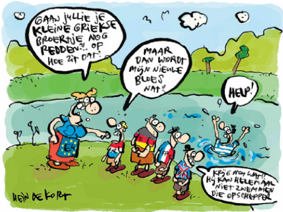
Illustratie: Hein de Kort