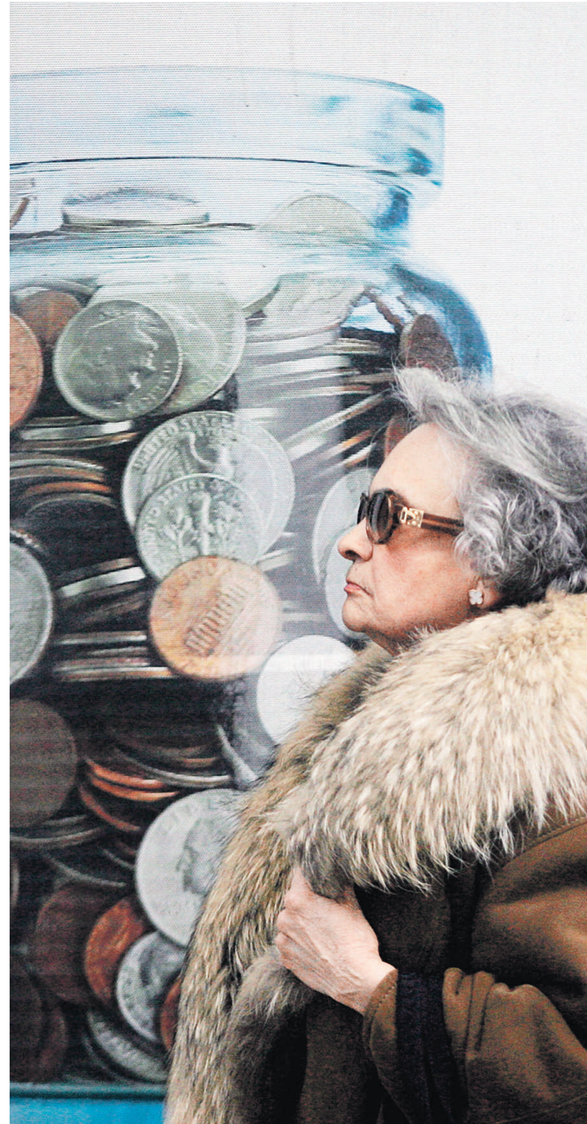
Een inwoner van Athene passeert een reclameposter van een spaarbank. De afgebeelde spaarpot bevat – ironisch genoeg – dollarmunten.