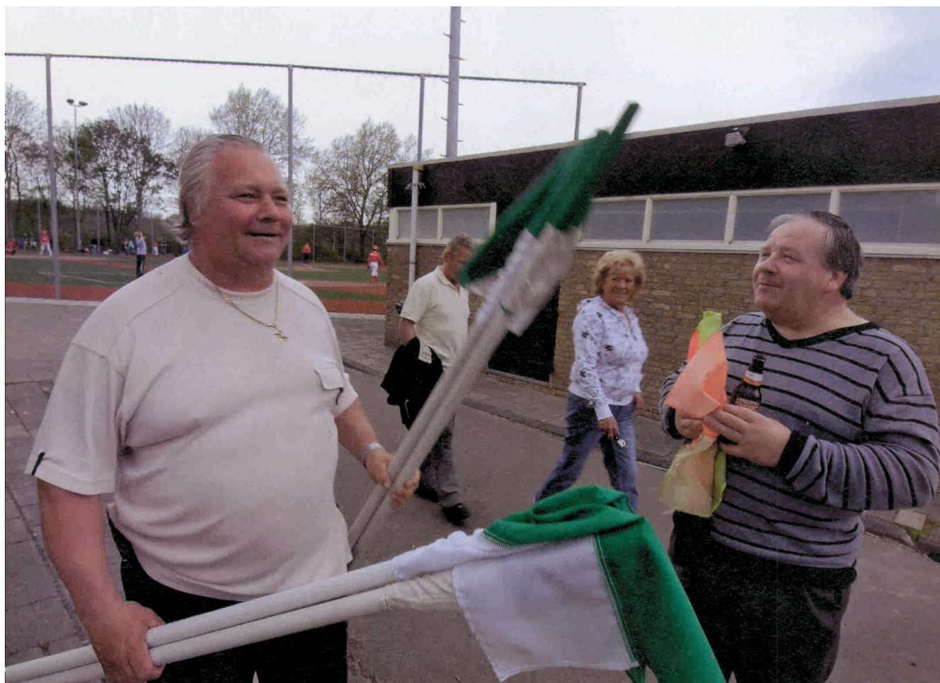
Vrijwilligers van de Leidse voetbalclub Lugdunum.