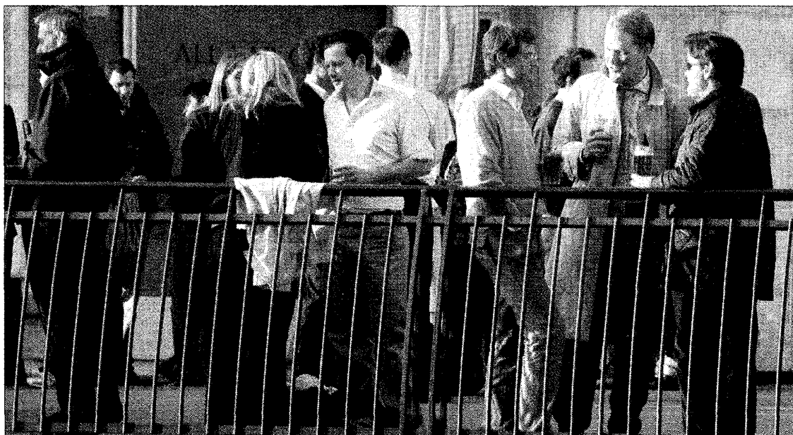
In de Londense City heffen de bankiers weer het glas. Zij krijgen hogere bonussen dan voor de crisis.