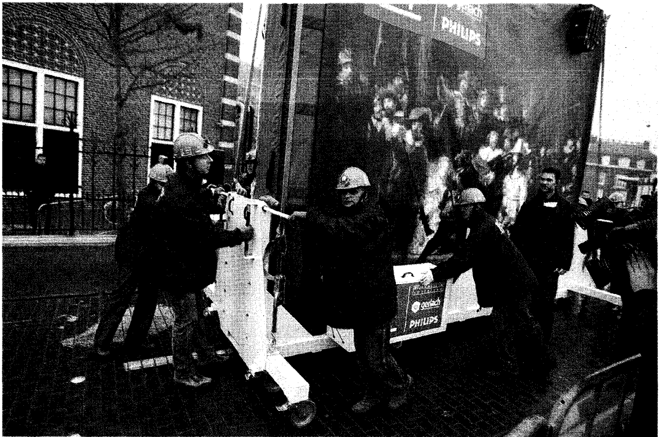
Rembrandts Nachtwacht werd in 2003 naar de Philipsvleugel van het Rijksmuseum getransporteerd wegens de renovatie van het gebouw. Philips doet als veel andere bedrijven aan kunstsporing, een activiteit die in gevaar komt als hoofdkantoren naar het buitenland worden verplaatst.