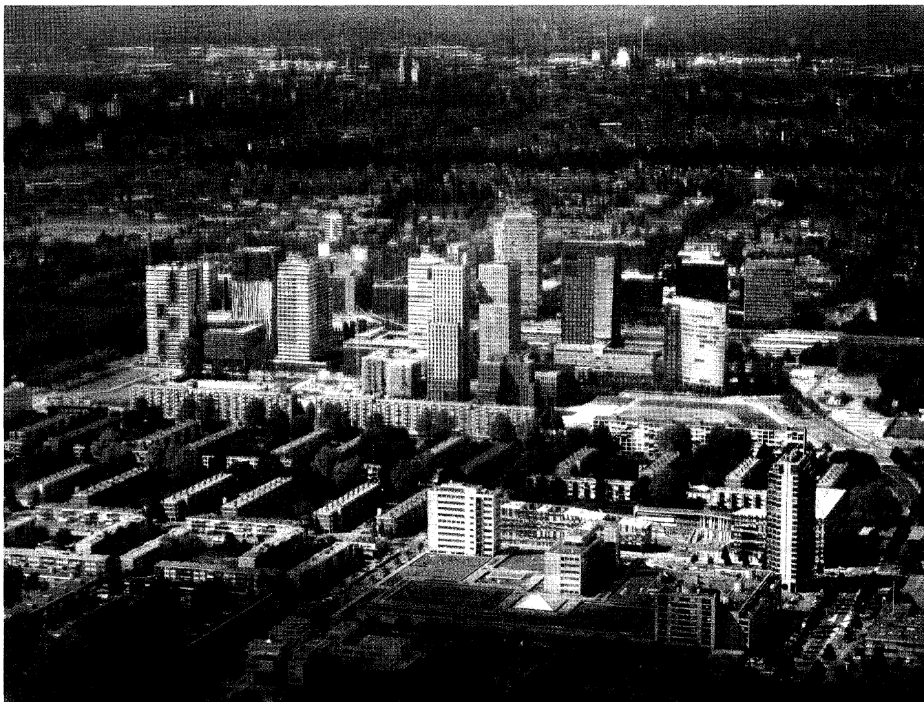
De Zuidas in Amsterdam, waar een aantal multinationals een hoofdkantoor heeft.