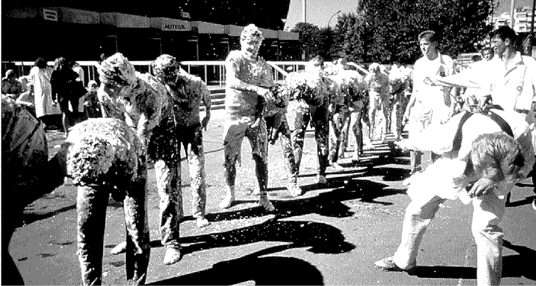
Ontgroeningsritueel op de Franse managementschool HEC.