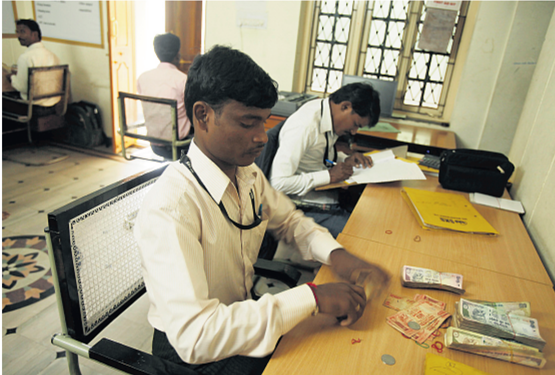
Anders bankieren in India: medewerkers van Microfinance Ltd dat kleine leningen verstrekt aan werkende vrouwen.