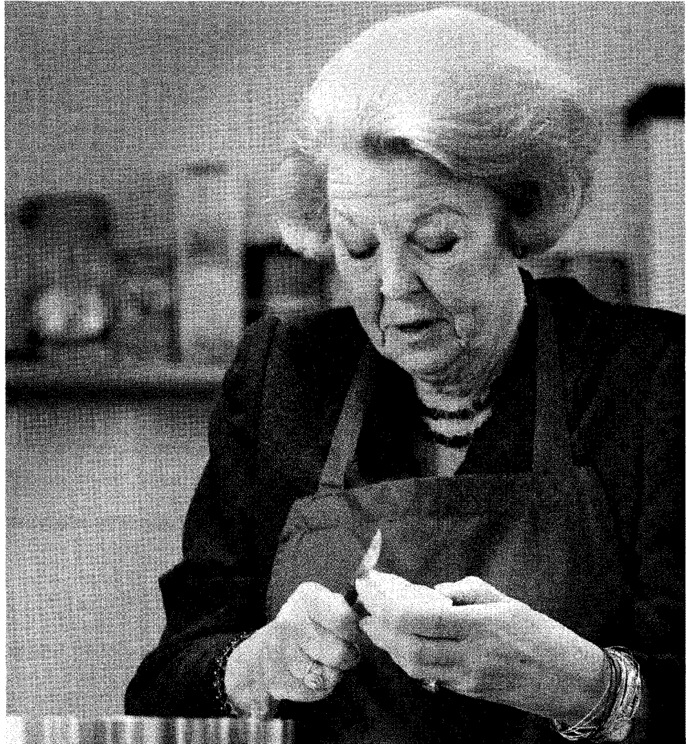
In 2009 deed ruim één op de vijf Nederlanders regelmatig vrijwilligerswerk. Hier helpt koningin Beatrix mee op een zorgboerderij.