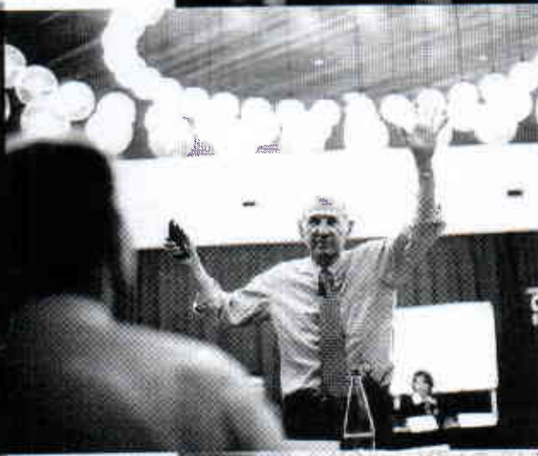
CIO-paneldiscussie (links) en een preconference-sessie hier met Manfred Kets de Vries.