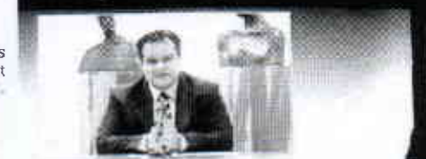
De staatssecretaris benadrukte het belang van ict.