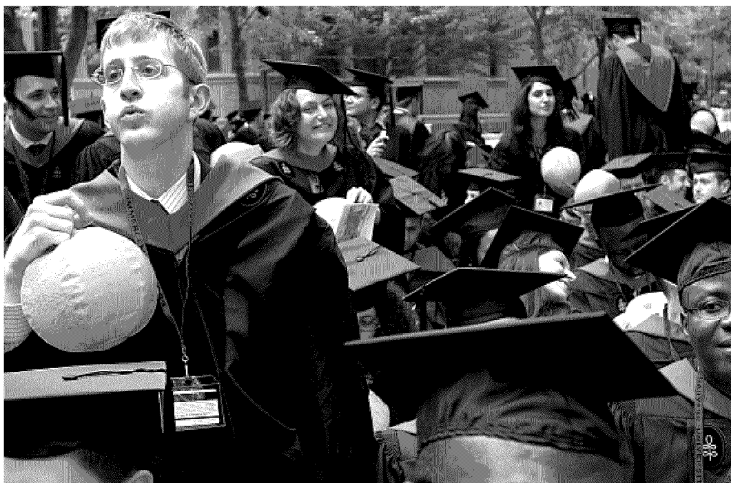
Als wereldwijde hofleverancier van mba's is de Universiteit van Harvard het brandpunt van kritiek.

Opfriscursussen voor mba's kunnen zulke zaken helpen voorkomen, meent Brown van Insead. Ceo's van banken waren dan in aanraking gekomen met het ethisch reveil dat hij ziet bij de studenten van nu. 'Het liefst zou ik studenten om de vijf jaar laten terugkomen', zegt hij. 'Alleen dan mogen ze hun mba-titel blijven voeren. Natuurlijk is dat voor ons financieel aantrekkelijk, maar uiteindelijk heeft het een meerwaarde voor iedereen.'